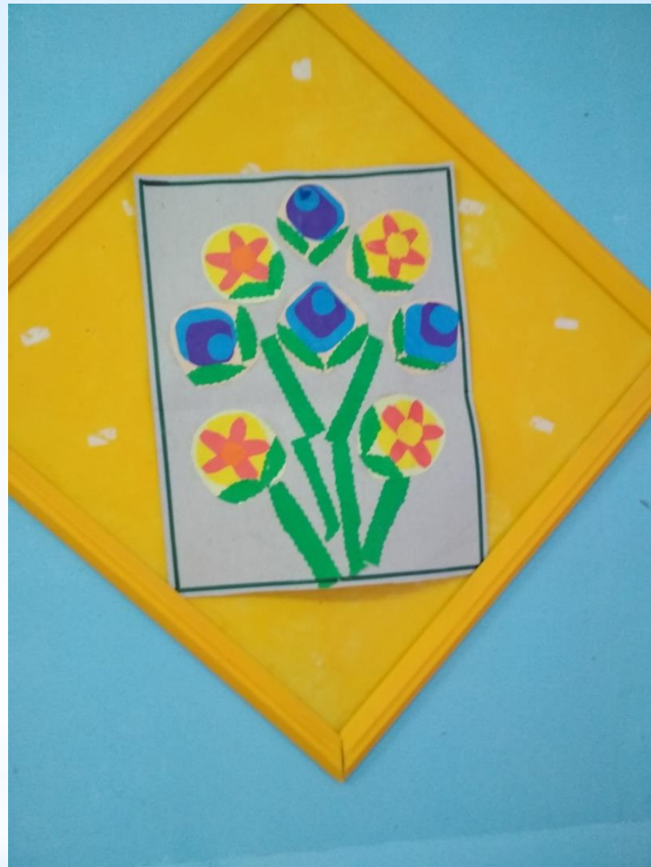
* «Гирлянды, букеты - городецкая роспись», коллективная работа